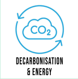
DECARBONISATION & ENERGY